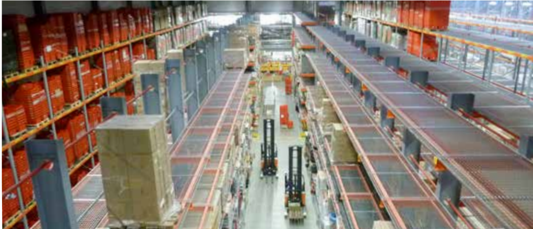
Innovative Fördertechnik Granit Parts

Einladung zur Besichtigung: Wilhelm Fricke GmbH in Heeslingen